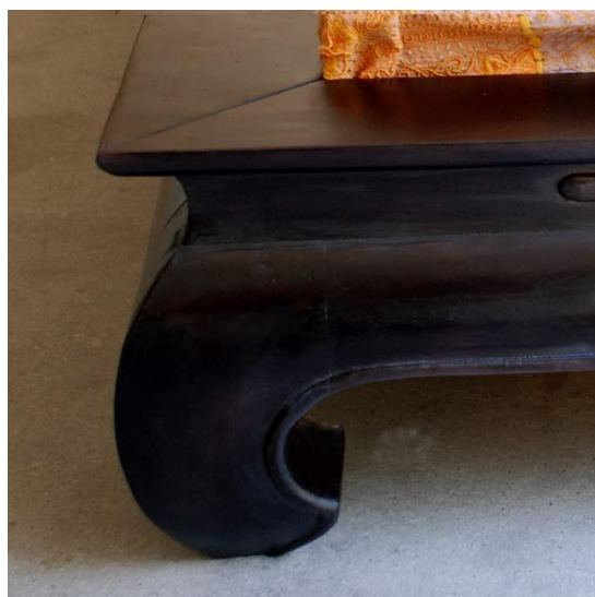
Beinform: Java Grande (16 cm Rahmen / Bein: ca. 14 cm)