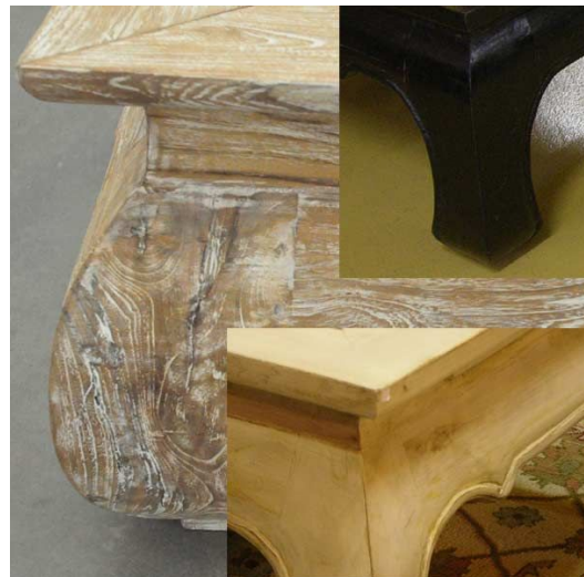
White Wash / Weiss / Schwarz