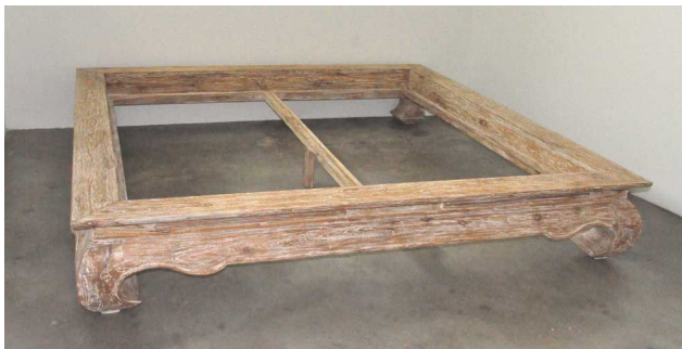
Blosse Auflage für Rost