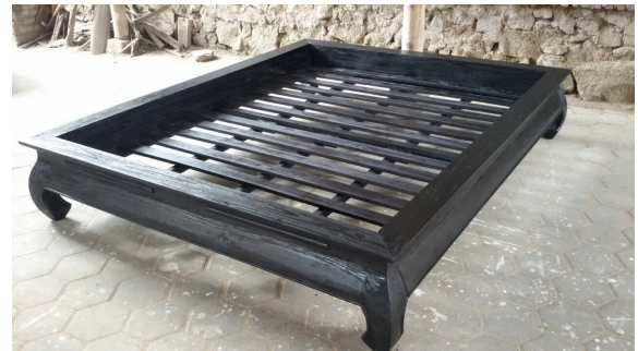
Einlage von Holzlatten