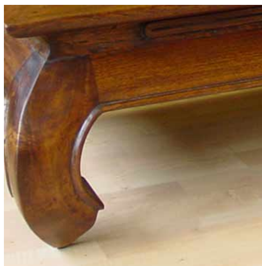
Beinform: Java Elegant (11 cm Rahmen / Bein: ca. 9 cm)